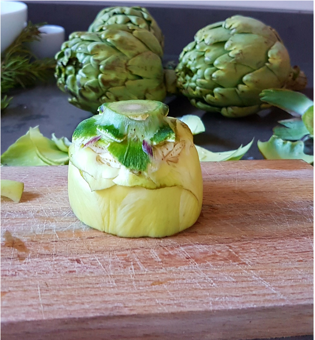
Corazón de alcachofa