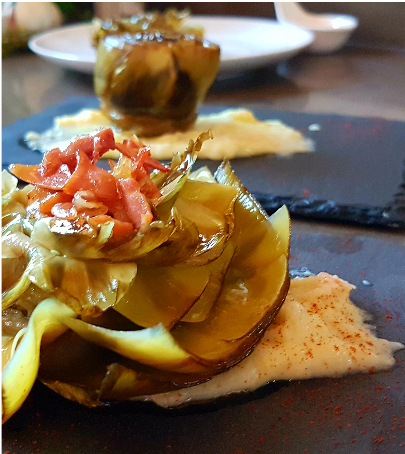
Alcachofas confitadas con lascas de jamón y parmentier trufado