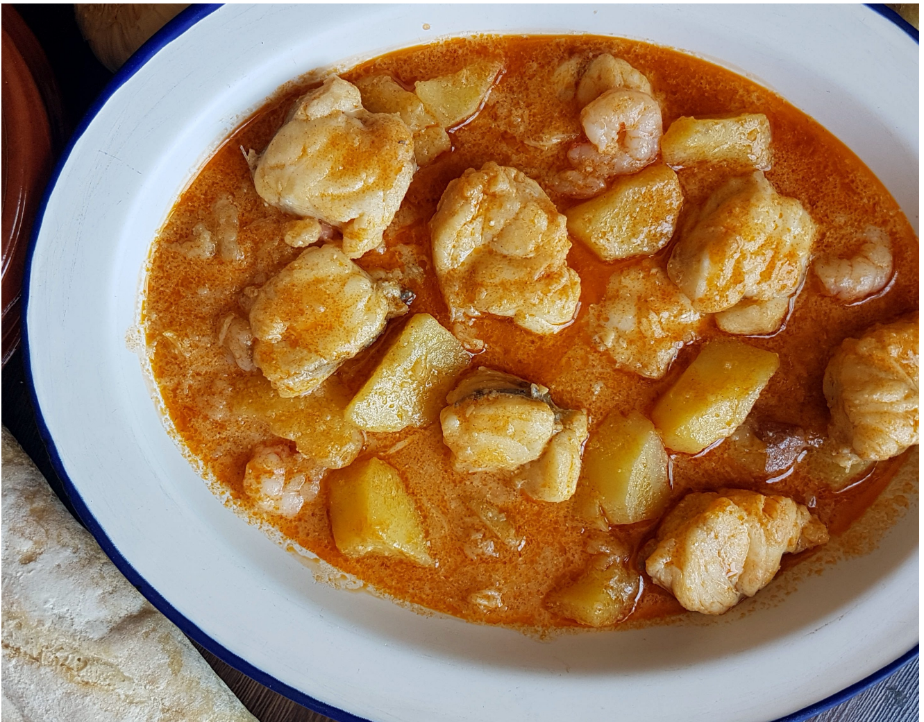
Suquet de rape y gambas

El guiso es contundente...aprovechar para mojar pan!