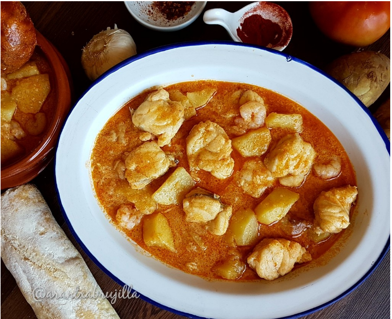
Suquet de rape y gambas

El suquet de rape y gambas es uno de los guisos marineros por excelencia en la zona del Mediterráneo. Aquí en Valencia lo encuentras en casi todos los restaurantes especializados en cocina valenciana. En cada zona del Mediterráneo lo elaboran de diversas maneras , yo os cuento la mía...como lo preparo en casa.