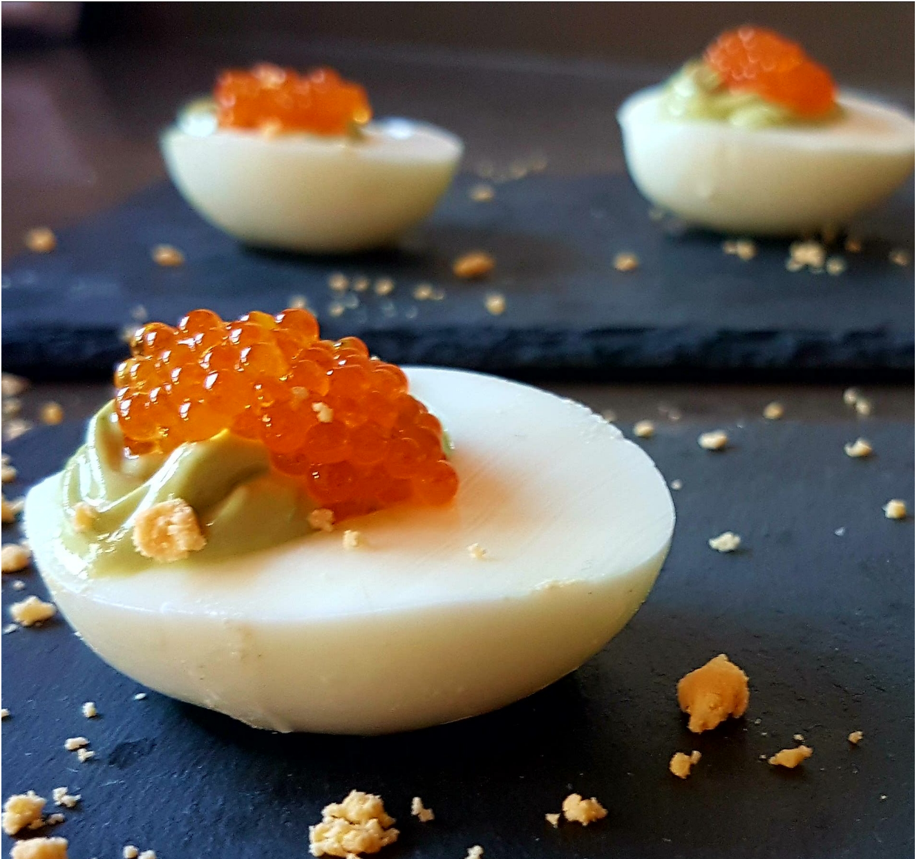
Huevos rellenos de crema de aguacate y huevas de salmón

Decoramos con las huevas de salmón y espolvoreamos con las yemas.