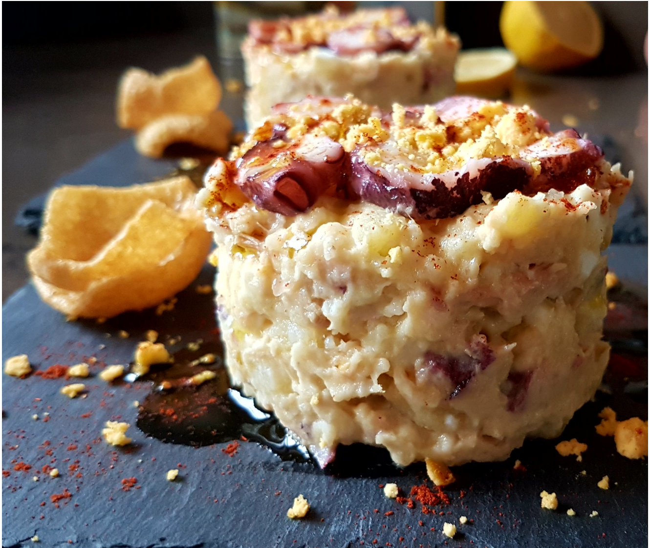
Ensaladilla de pulpo

Hoy os voy a explicar cómo preparar una estupenda ensaladilla de pulpo. Es perfecta para entrante individual o compartido. Y os quedará muy bien si teneis alguna celebración especial, donde queráis sorprender a vuestros invitados.