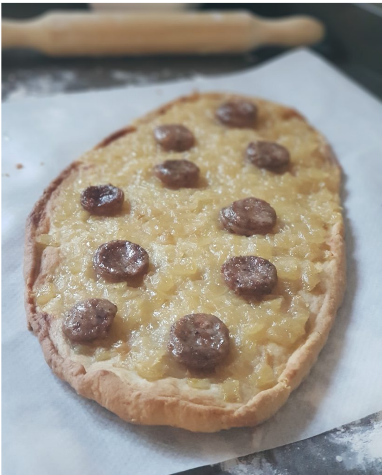
coca de ceba i blanquet

hora de sacar , dejar templar y disfrutar.