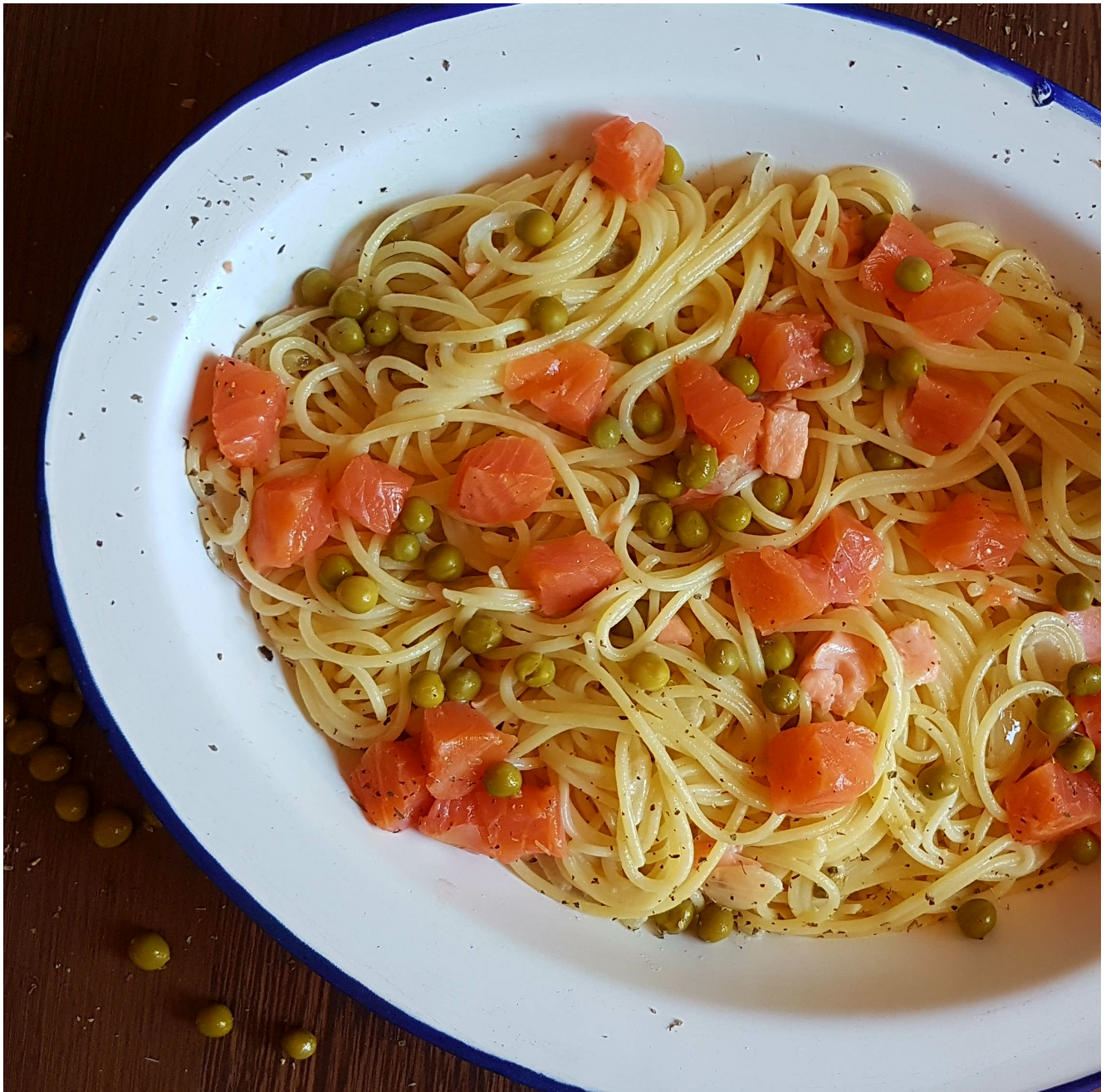
Spaghetti con salmón ahumado

Servir bien caliente y a disfrutar de esta riquísima pasta. En mi receta los he espolvoreado con un poco de eneldo seco.