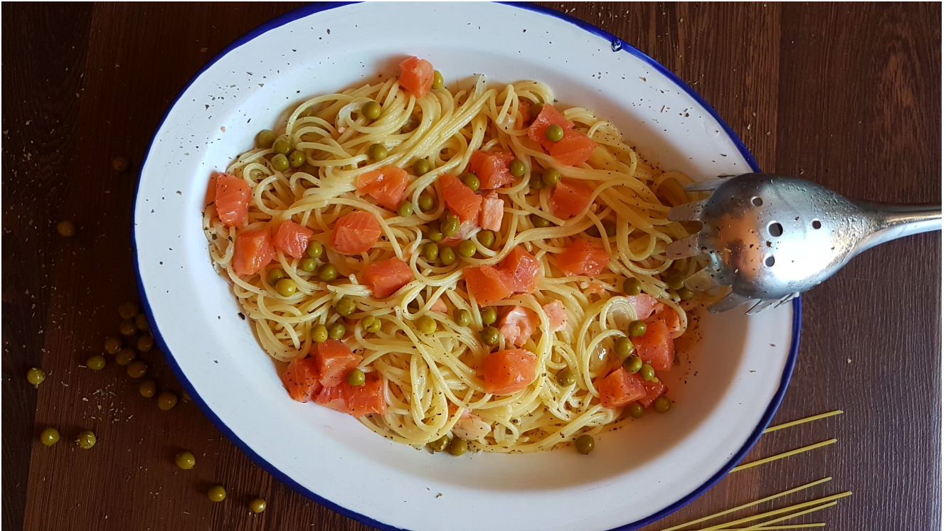
Spaghetti con salmón